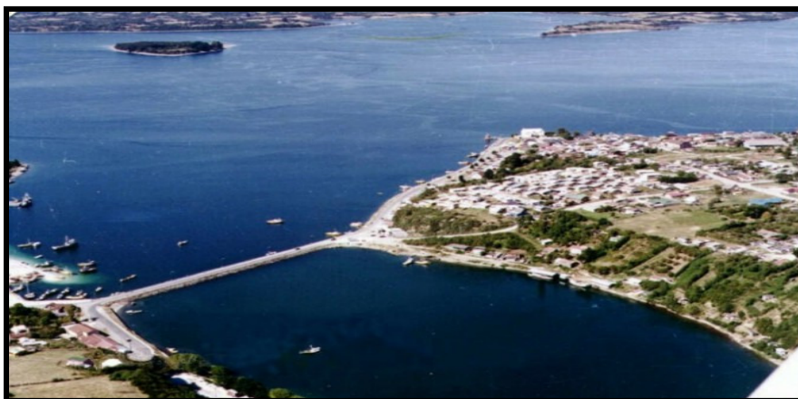
Pedraplén de Calbuco

Limita al norte y noroeste con las comunas de Puerto Montt y Maullín, al sur con el Golfo de Ancud y el Canal de Chacao y al este con el Seno de Reloncaví. La capital comunal es la ciudad de Calbuco, ubicada en la isla del mismo nombre, la cual esta unida al continente a través de un pedraplén.