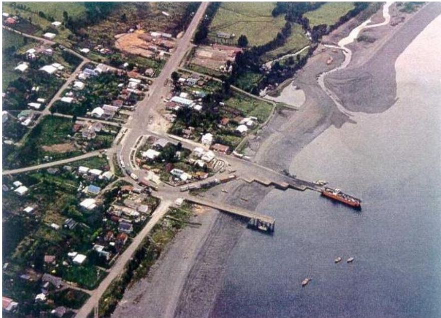
Terminal de transbordadores ubicado en Parga, junto a paseo peatonal.

El área perimetral a estos usos es predominantemente residencial, a excepción de instalaciones industriales de reciente instalación.